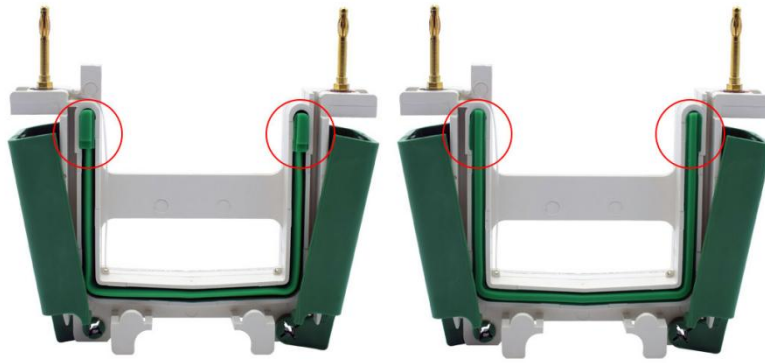
图2. 碧云天、Bio-Rad等公司的电泳槽U型硅橡胶密封条的突起结构图。由于碧云天的BeyoGel™ Elite PAGE预制胶的该部位是平的,使其兼容几乎所有厂家的小型胶电泳槽,所以电泳时须将具有突起结构的硅橡胶密封条(左图)取出后反过来安装(右图),使其没有突起的平滑面朝外,从而防止漏液。